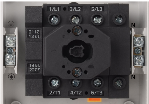
Схема перемикання 41411