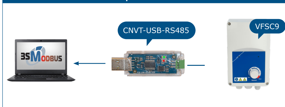
Fig. 1 Esempio di collegamento del controller elettronico della velocità della ventola VFSC9 di Sentera a un computer tramite CNVT-USB-RS485