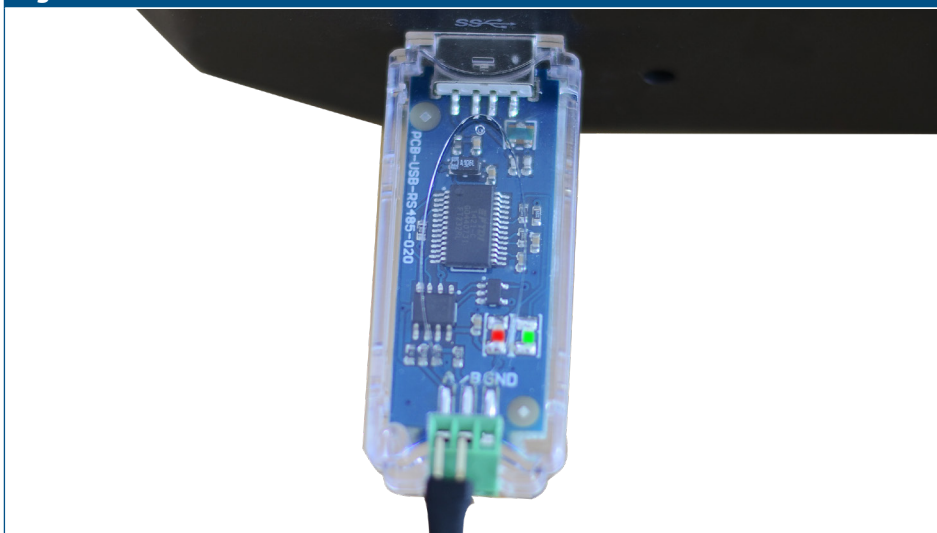
Fig. 3 Indicazione di comunicazione Modbus